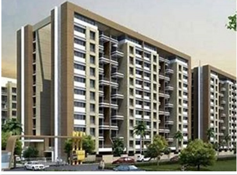
पार्क कनेक्ट बाय प्राईड पर्पल