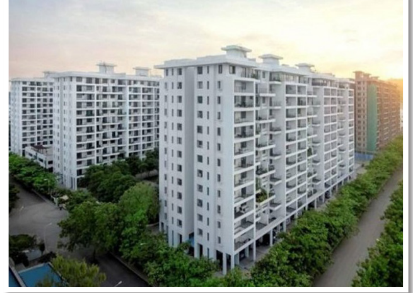
IV निवा बाय कोलते पाटील डेव्हलपर्स