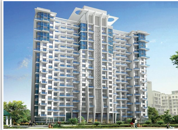
कुंदन इटर्निया बाय कुंदन स्पेसेस