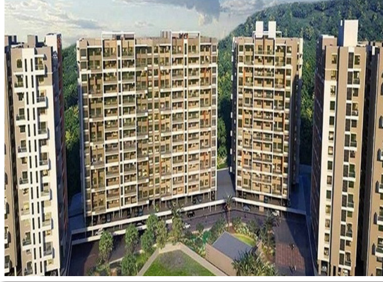
२४ के स्टारगेझ बाय कोलते पाटील डेव्हलपर्स